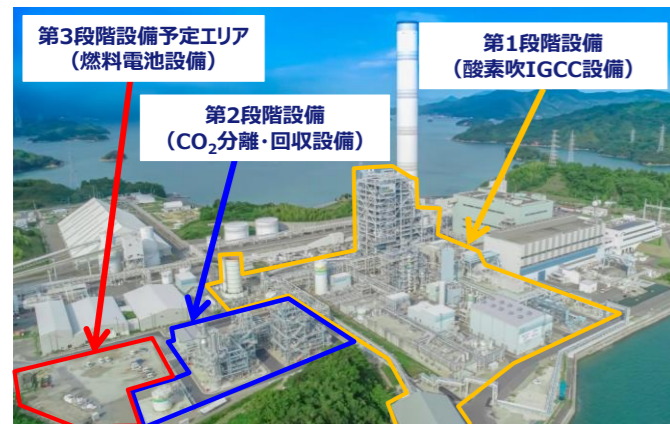
図 燃料電池設置予定位置（現状写真）